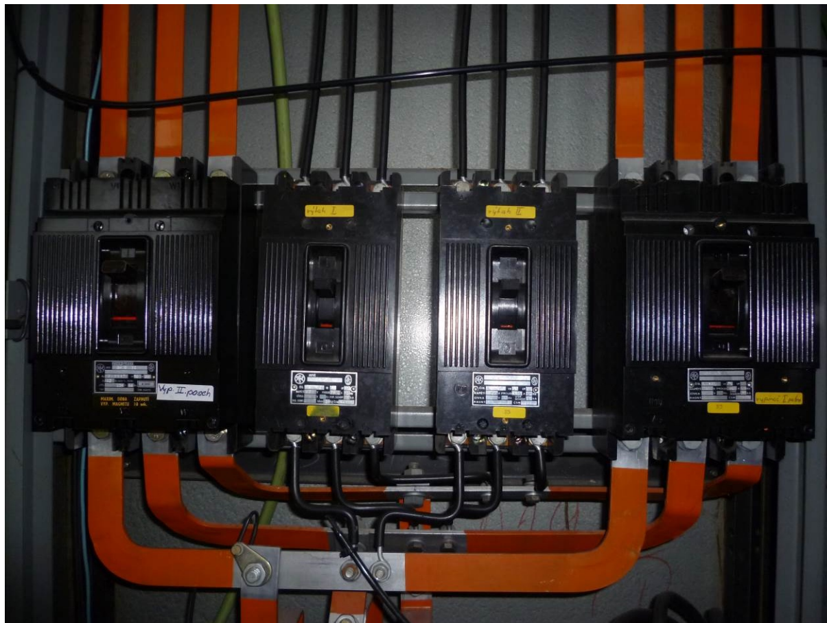
Obrázek 10 – Rozvaděč výtahu