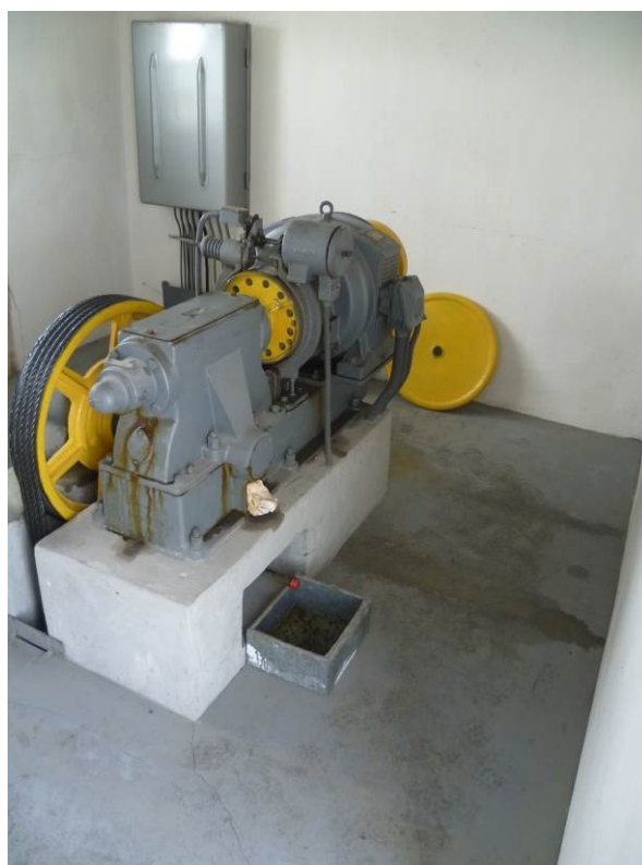
Obrázek 7,8,9 – Strojovna výtahu “B”