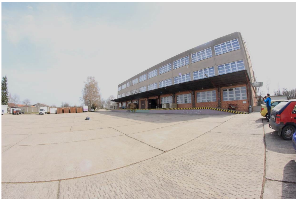
Obrázek 1 – Severozápadní (uliční) fasáda