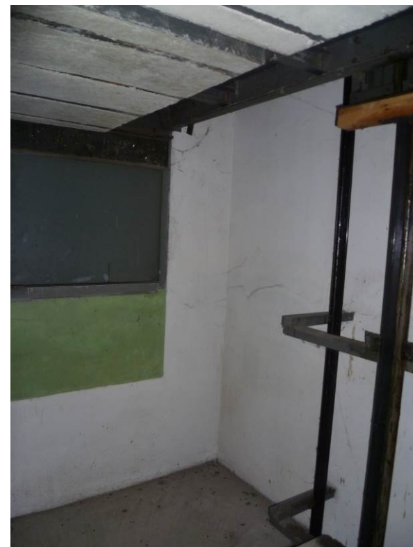
Obrázek 3,4,5,6 – Výtah "B"